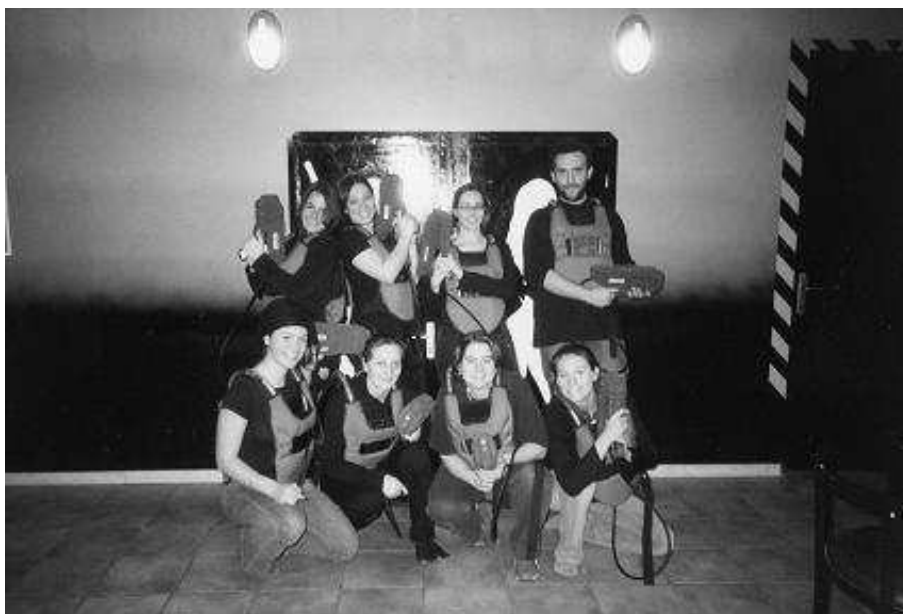
Les deux équipes...